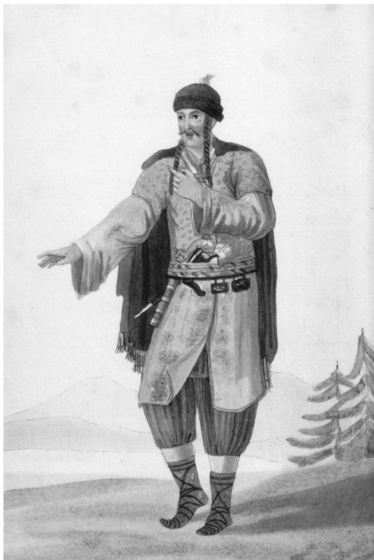
Costume du gouverneur du Monténégro. Aquarelle du colonel Vialla