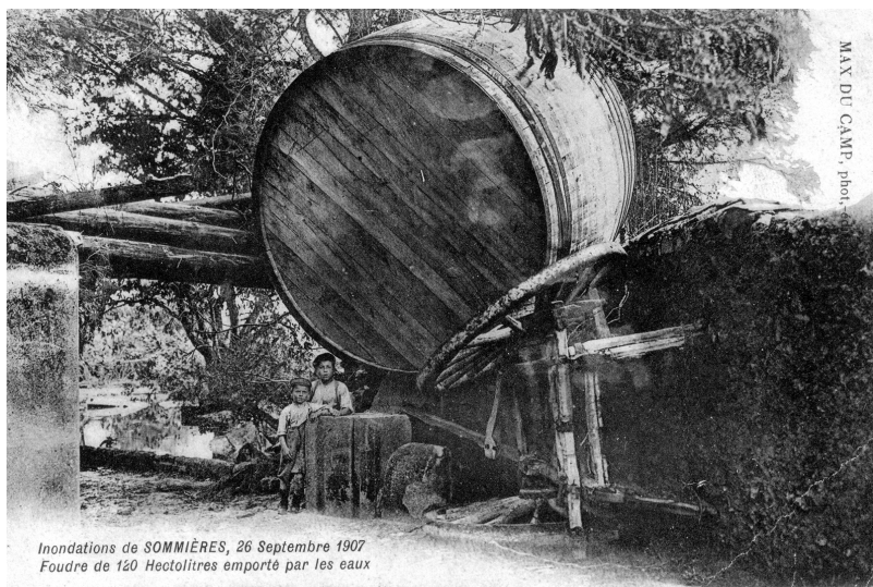
Inondations de Sommières, 26 Septembre 1907