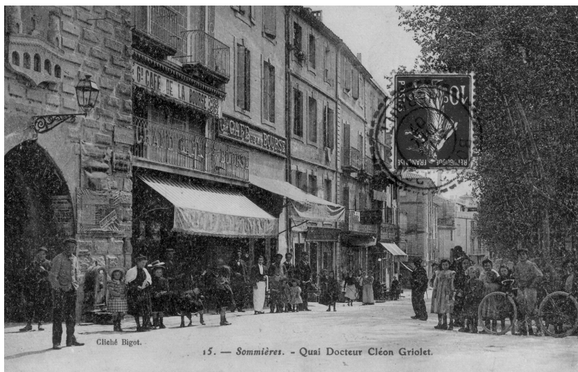
Sommières. Quai Cléon Griolet